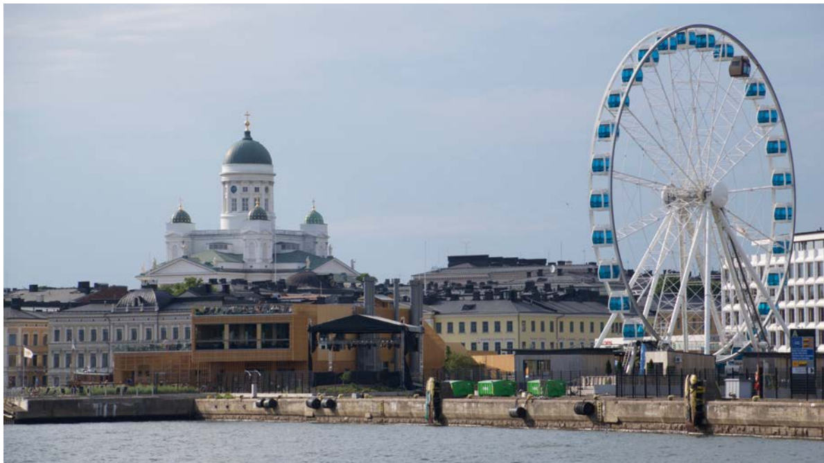
Helsinki waterfront

Estland en Finland Studiereis | 21 tot 25 september 2022